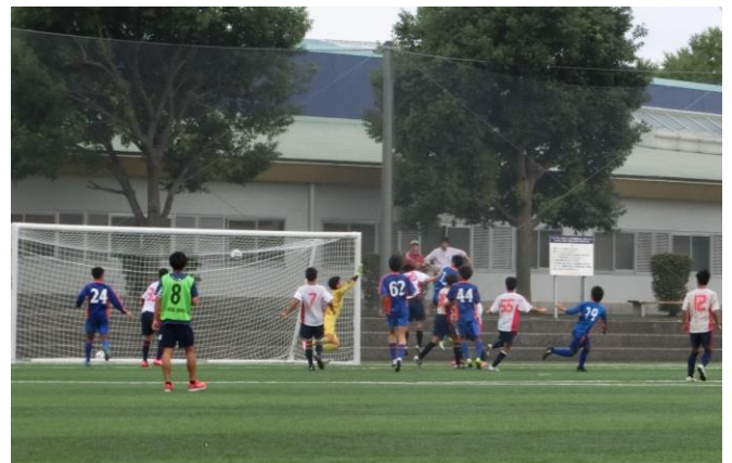
<大学生とのTRMはいい経験となる>