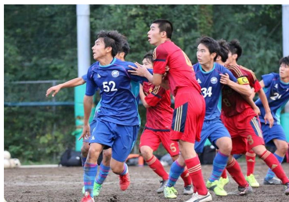
<順位決定戦 VS 町田ゼルビア Tリーグの懸ったゲームだけに激しい闘いが繰り広げられる>