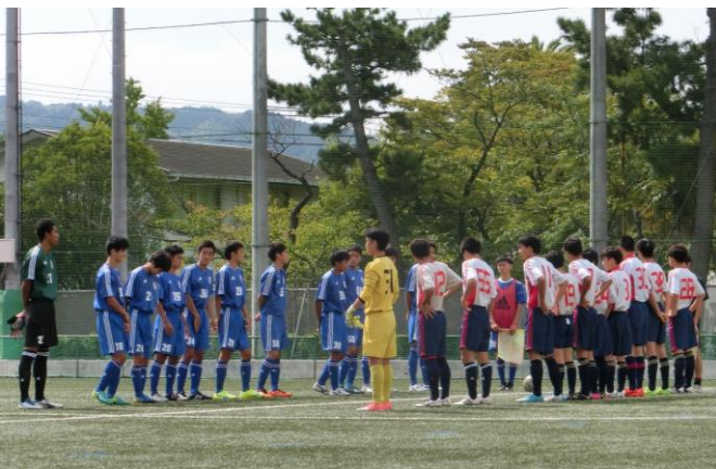
<日本代表を多く輩出している清水桜ヶ丘高校>

恐らく、これはゲームに関してだけではなく、W-UP から C-Down(準備から片付けるところ)までがセットであり、このスタイルを築き上げるためには、オフ・ザ・ピッチでの姿勢、つまり日常生活(学校生活)が基盤になっているのではないのでしょうか?名門校(強豪校)から学ぶことはたくさんあります。TRMを通し学ぶべきところをどんどん吸収して、今後の東高サッカー部に活かしていきたいと思います。