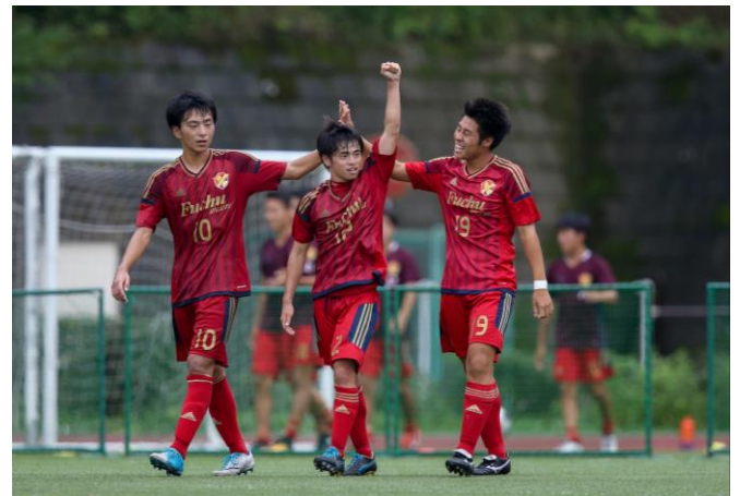
<この瞬間(抽選会)から、二次トーナメントに向けての闘いは既に始まっている!!>