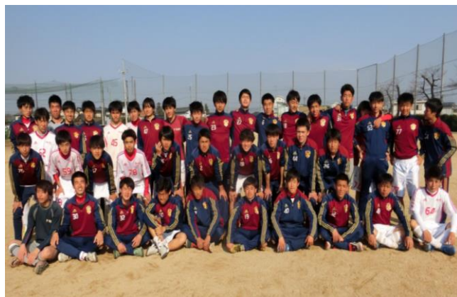
<新年度がスタート!!上級生としての 自覚 と 誇り を持って日々過ごす。その姿を見て後輩は育つ!!>