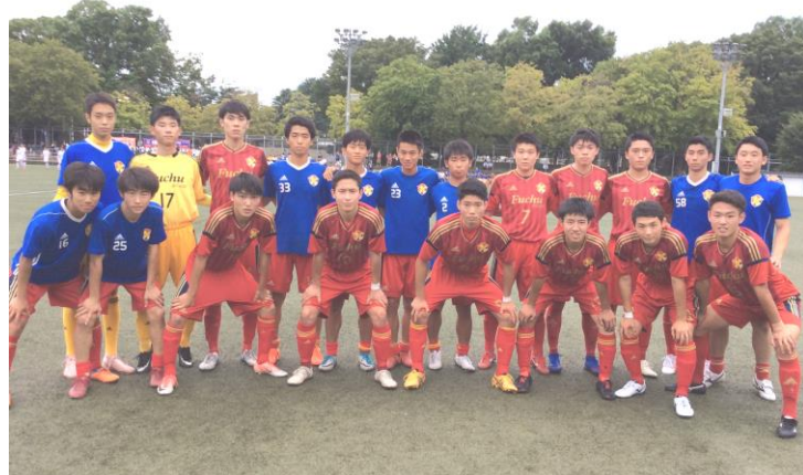
<VS 狛江 選手権に向けても、T3リーグ昇格に向けても負けられない闘い>