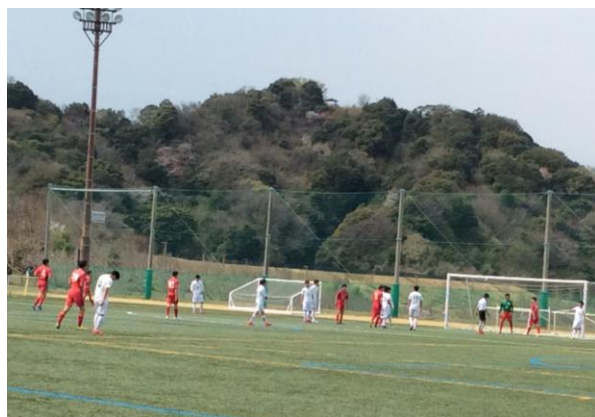
<エコパ会場の隣の人工芝グラウンドにて>

今年は天候に恵まれ全日程予定通り行うことができました。7日間にも及ぶ武者修行、三月も土浦フェスティバルや土日のTRMを合わせると25ゲーム。一昨年同様、強度の高い厳しいものでした。しかし、子どもたちは、年度末となった春の武者修行では日に日に逞しさを増し、新シーズンに向けて大きな自信を得ることができたと確信しています。また、一次中断していたゲームのビデオ撮影を行い、終了後直ぐにビデオを見ることにより客観的な視点でゲームを振り返りながら、子どもたちが課題を発見し、解決する方法を考えて練習に繋げるというサイクルを作り、主体的に取り組む環境が出来上がりつつあります。チームは春遠征の成果を活かし、 4月3日(水)に開幕 するTリーグ VS 葛飾野に向け、準備は万端です。