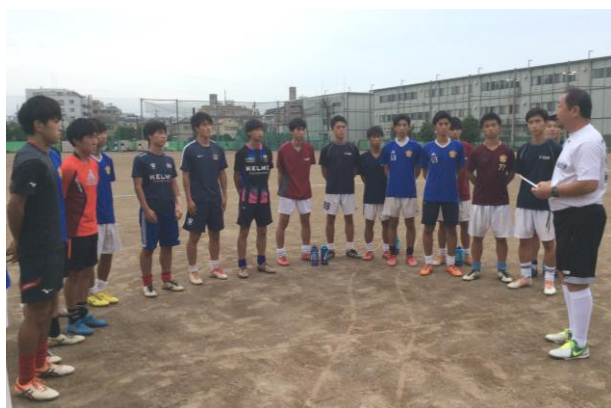
＜坂本氏との出会いも東高のターニングポイント＞

新チームとなり二か月近く経過しましたが、「 アタッキングディフェンス 」をより進化させるために、失敗を恐れずに(最近は大失点が多く困っていますが、今は我慢の時期です)チャレンジしているところです。